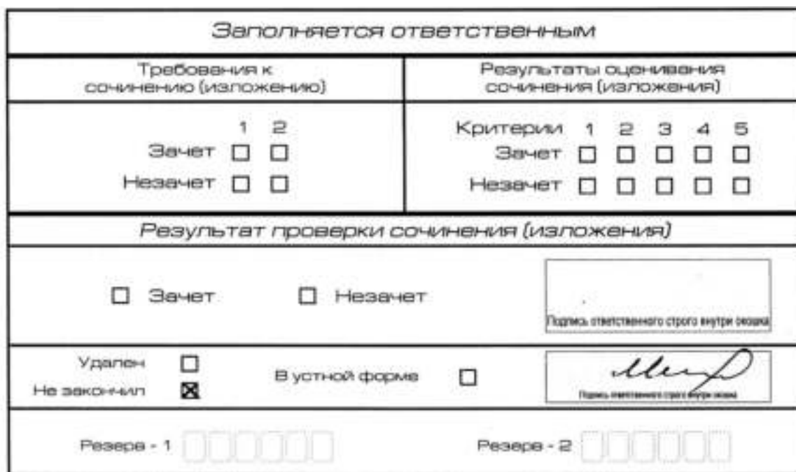
Рис. 12. Заполнение полей нижней части бланка регистрации (участник не закончил написание сочинения (изложения) по уважительным причинам)

В случае если участник итогового сочинения (изложения) по состоянию здоровья или другим объективным причинам не может завершить написание итогового сочинения (изложения), он может покинуть место проведения итогового сочинения (изложения). Члены комиссии по проведению итогового сочинения (изложения) составляют «Акт о досрочном завершении написания итогового сочинения (изложения) по уважительным причинам» (форма ИС-08), вносят соответствующую отметку в форму ИС-05 «Ведомость проведения итогового сочинения (изложения) в учебном кабинете ОО (месте проведения)» (участник итогового сочинения (изложения) должен поставить свою подпись в указанной форме). В бланке регистрации указанного участника итогового сочинения (изложения) необходимо внести отметку «Х» в поле «Не закончил» для учета при организации проверки, а также для последующего допуска указанных участников к повторной сдаче итогового сочинения (изложения) в дополнительные сроки. Внесение отметки в поле «Не закончил» подтверждается подписью члена комиссии по проведению итогового сочинения (изложения) (см. рис. 12).